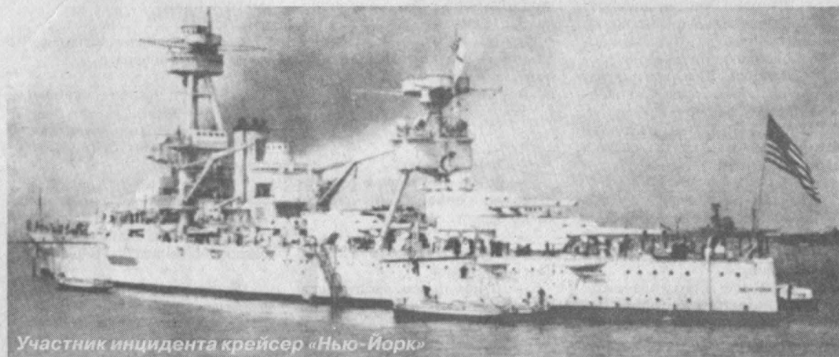
Участник инцидента крейсер «Нью-Йорк»

Странное какое-то отражение у Венеры. Невидимое в темноте, но видимое в лучах прожекторов. Неуязвимое для артиллерийских снарядов, но видимое на экране локаторов. Что же это на самом деле?