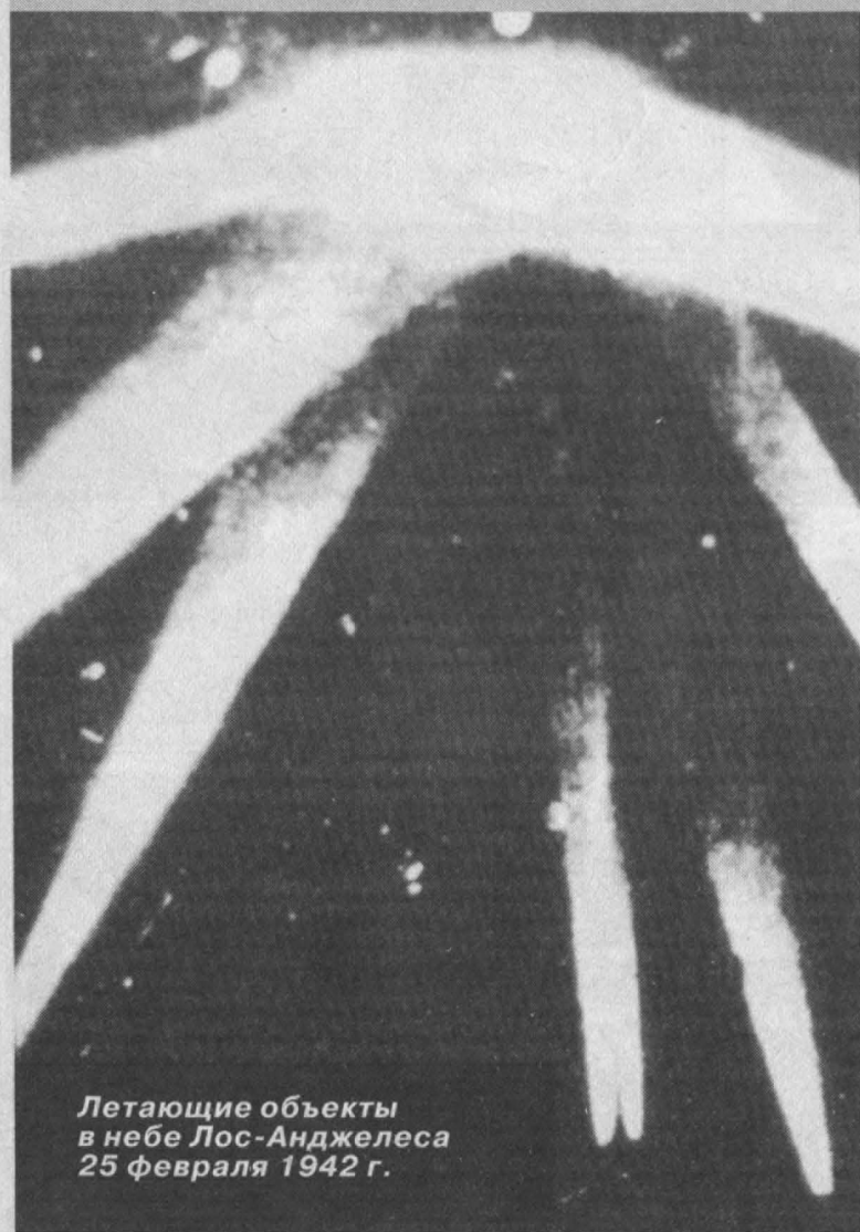
Летающие объекты в небе Лос-Анджелеса 25 февраля 1942 г.

Во время летних маневров войск Ленинградского военного округа истребители-бомбардировщики «Миг-27» отрабатывали боевое применение оружия и бомбометание. Оно проводилось в ночное время на кингисеппском полигоне, в 110 км от Санкт-Петербурга. По учебным целям лет-